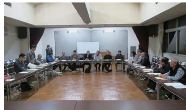
平成30年玉川地区懇談会の様子